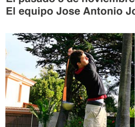
Jugador en el campo durante el torneo